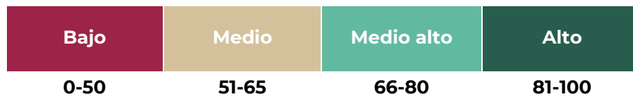
Figura 2. Niveles de avance de las Entidades Federativas y Municipios/DTCDMX

Por último, a partir de las puntuaciones y ponderaciones anteriormente descritas, se establecieron rangos de avance con la finalidad de agrupar a los entes públicos en función de las valoraciones globales obtenidas. En la Figura 2 se presenta el nivel de avance en función de la valoración cualitativa alcanzada.